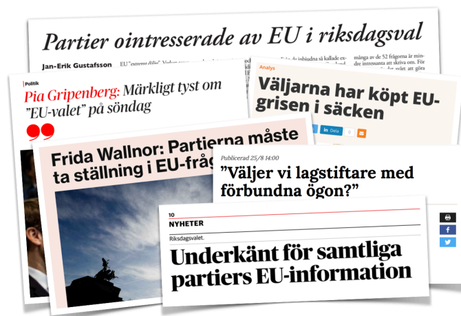
Projektet EU i riksdagsvalet fick bred uppmärksamhet i svenska medier.

Den särskilda webbplats ( www.val2018.cfe.lu.se ) som skapades för att redovisa CFE-projektet EU i riksdagsvalet bidrog också till att informera om universitetets forskarresurser. När webbplatsen lanserades fick den mycket uppmärksamhet i nationell media, och de 26 forskare från 5 fakulteter som angavs som experter – under tolv olika sakområden – synliggjorde bredden av LU-forskare med europakoppling.